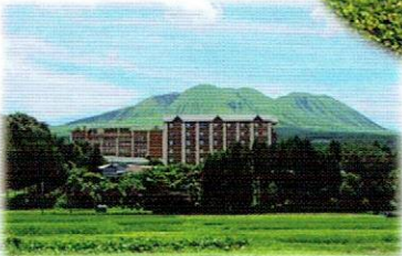
<ビラパークホテル>